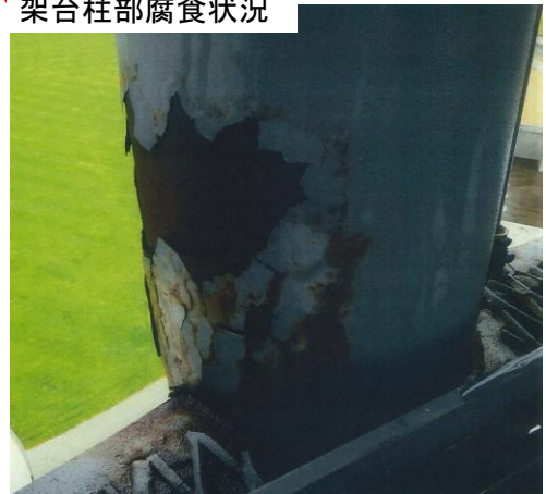
架台柱部腐食状況